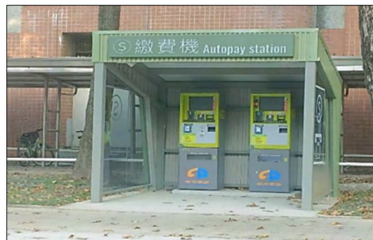
現金繳費機(第二處)