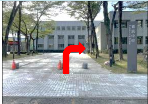
2. 請於資訊中心對面停車，步行至資訊中心