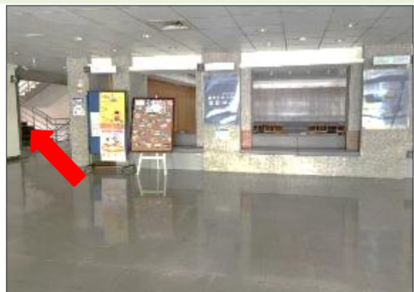
4. 進入資訊中心後，左轉上樓梯至二樓