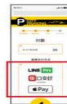
4 選擇 『支付方式』