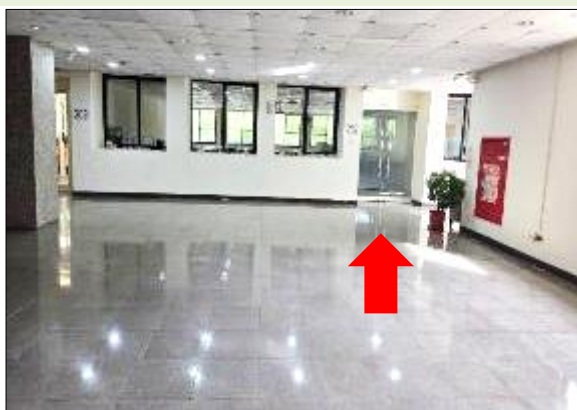
7. 直走到底即為 AC202 教室