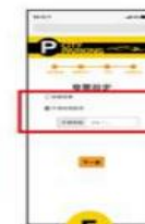
5 選擇發票 『捐贈或載具』 若選擇立「統一編號」或「紙本」 請至線下繳費機操作。