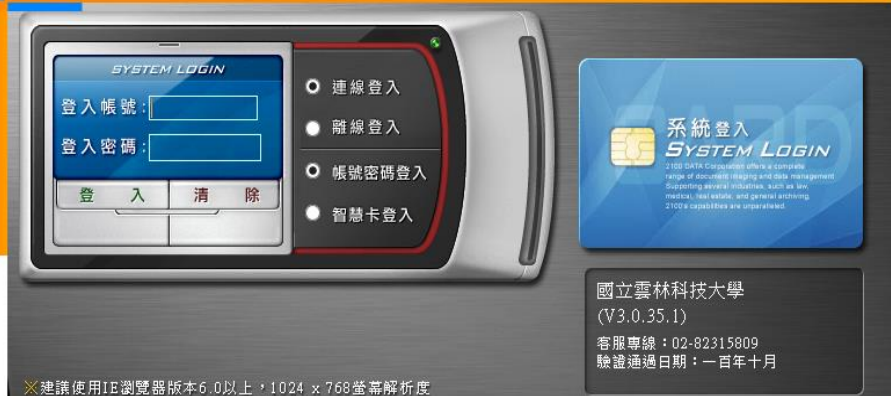
公文系統登入畫面