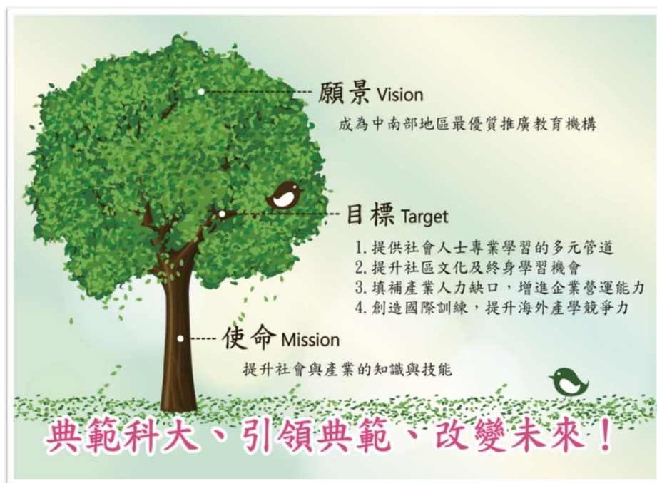
圖 中心發展願景圖