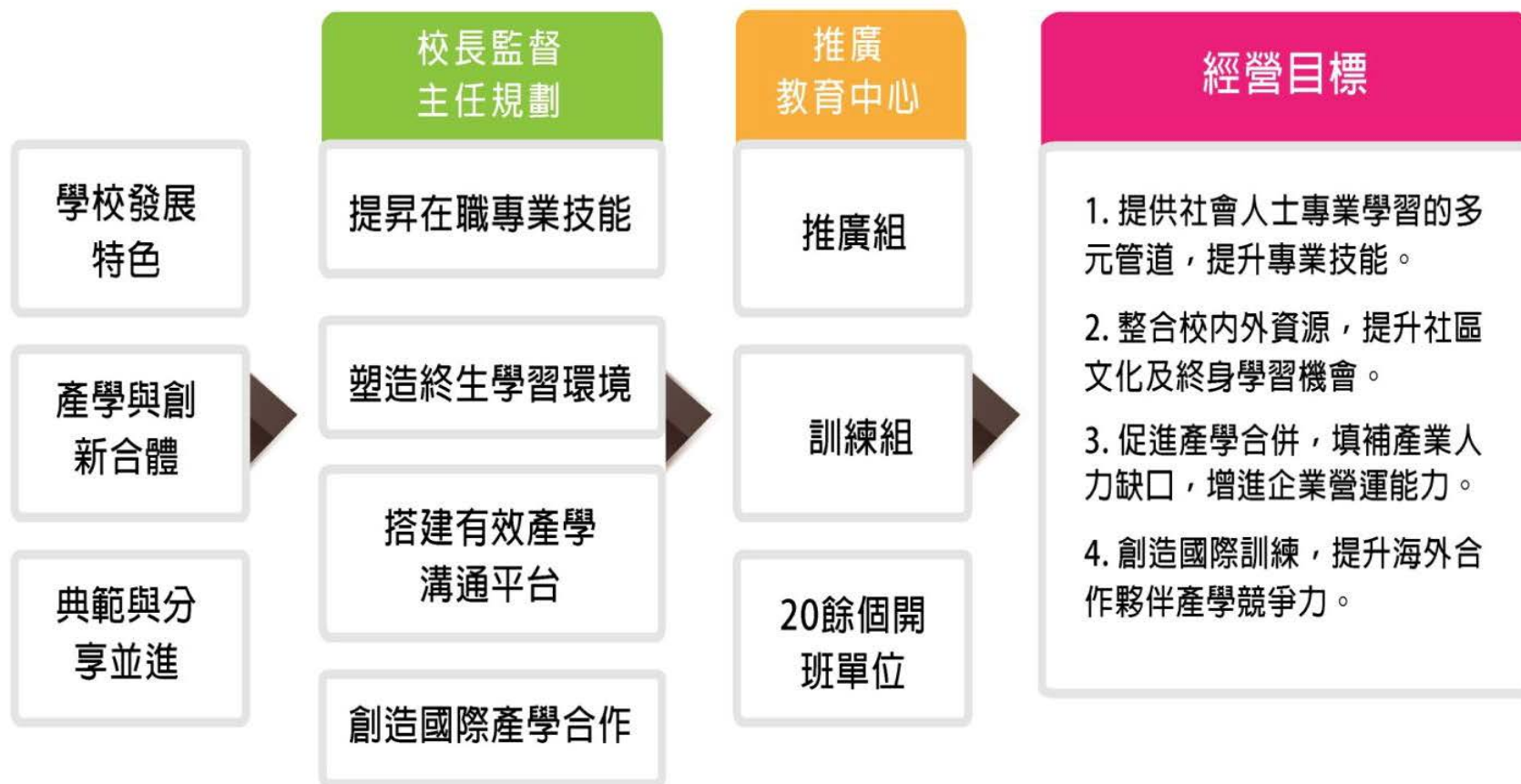
圖 雲科大推廣教育經營目標