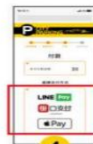
4 選擇 『支付方式』