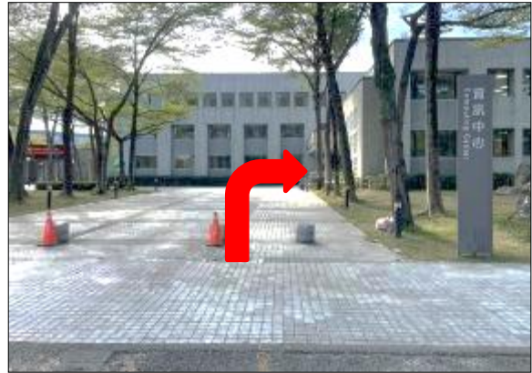
2. 請於資訊中心對面停車，步行至資訊中心