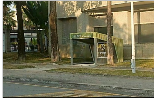
現金繳費機(第一處)