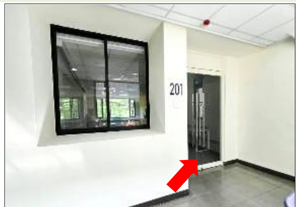
8. 推廣教育中心 201 教室