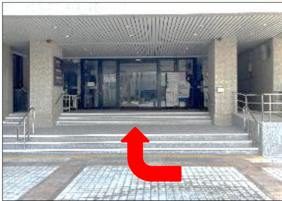
3. 右轉步行進入資訊中心大樓