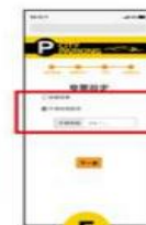
5 選擇發票 『捐贈或載具』 若選擇立「統一編號」或「紙本」 請至線下繳費機操作。