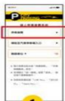
1 選擇 『停車繳費』