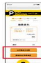
3 確認後請選擇 『折抵或支付』 如需折抵先選【牌碼折扣】發票補登 後，再點選【行動支付付款】