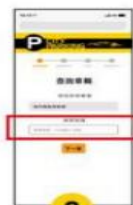
2 輸入 『車牌號碼』 車牌號碼ABC-1234 輸入ABC1234