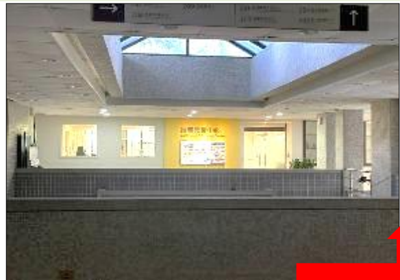
6. 看到推廣教育中心後右轉再左轉