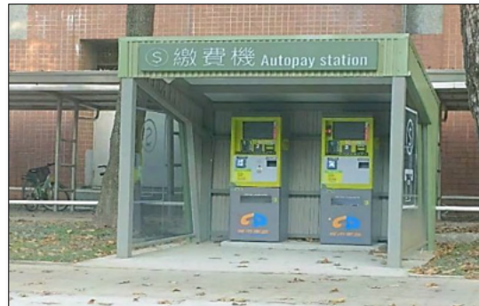
現金繳費機(第二處)