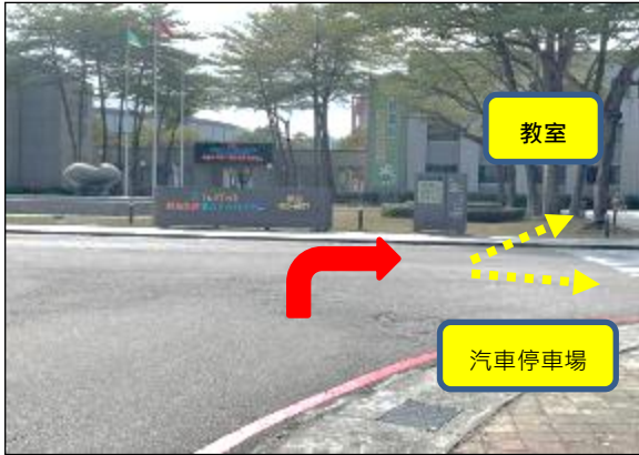
1. 雲科大正門進來第一個右轉即為資訊中心