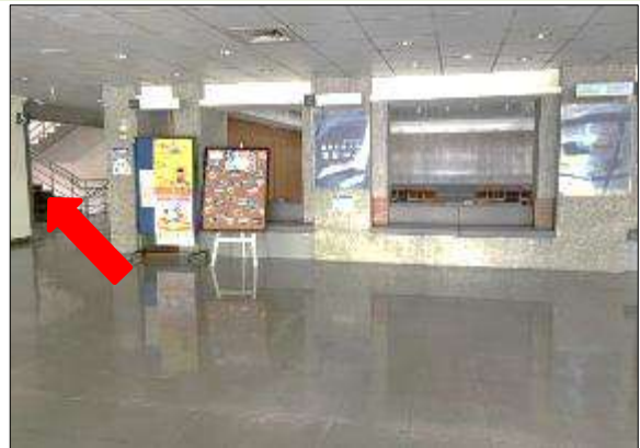
4. 進入資訊中心後，左轉上樓梯至二樓