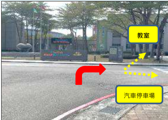
1. 雲科大正門進來第一個右轉即為資訊中心