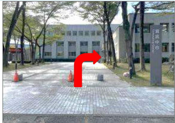
2. 請於資訊中心對面停車，步行至資訊中心