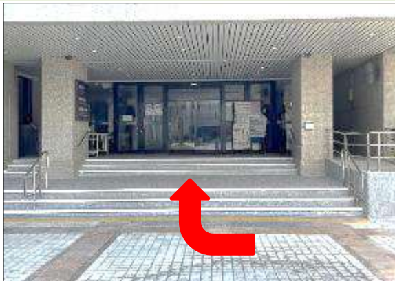
3. 右轉步行進入資訊中心大樓