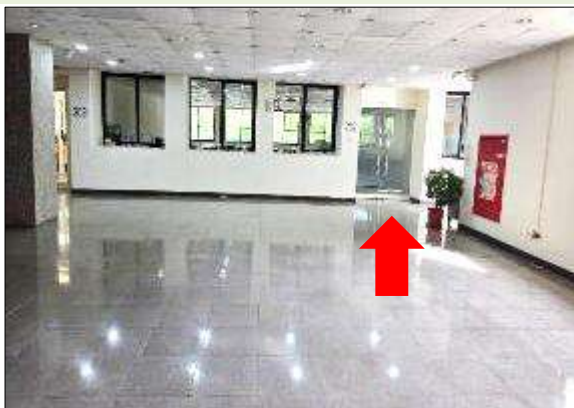
7. 直走到底即為 AC202 教室