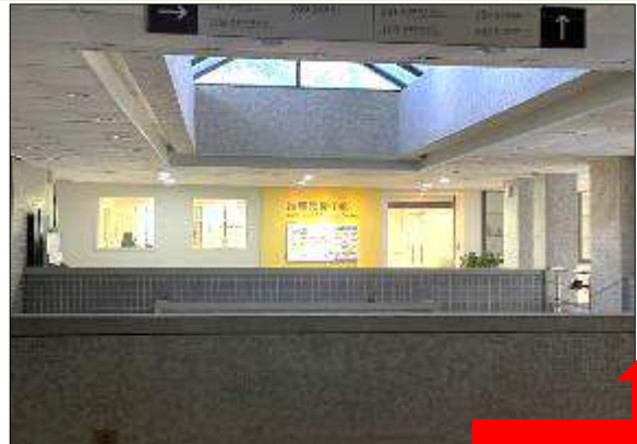
6. 看到推廣教育中心後右轉再左轉